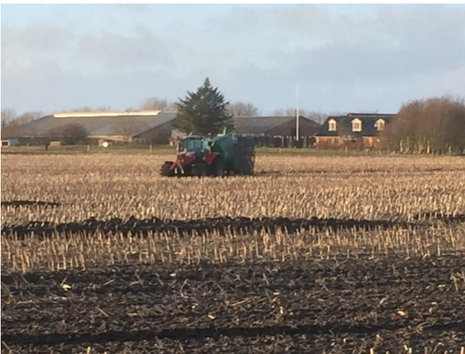
Figur 1 Traktor med gyllevogn fastkørt d. 22 februar 2016 først trukket fri d. 24.

Omkring områderne "A" og "C" har vi vanskeligt ved at se det attraktive i beliggenhederne. Området benævnt "A" er meget vådt. Dette skyldes at al laget i heden der ligger op ad området, hindrer vandet i at trænge ned, og derfor følger området hældning som fører det ned i området.